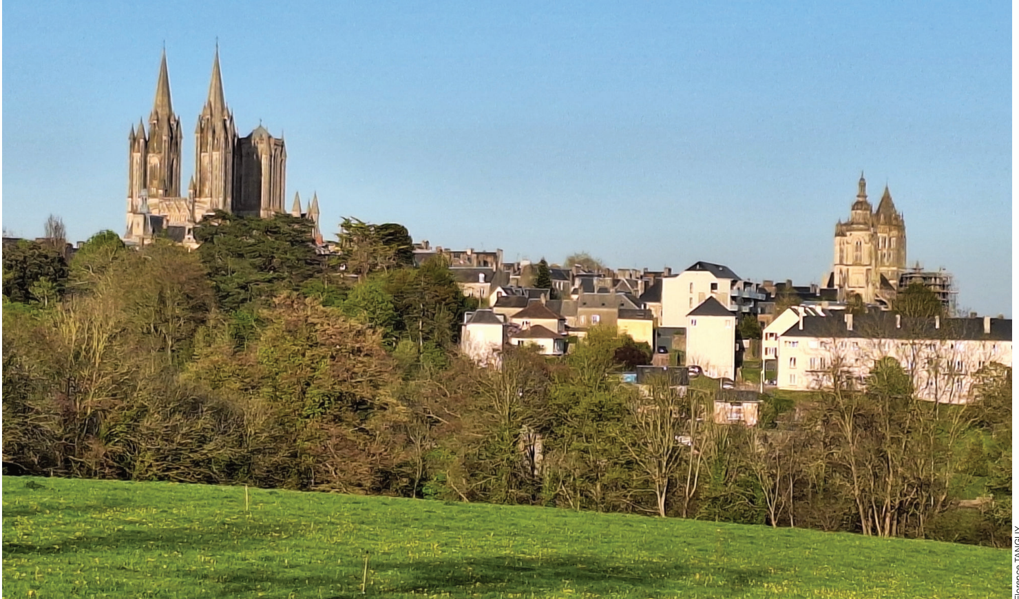
Vue dégagée sur la ville de Coutances