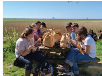
Pique-nique avec vue