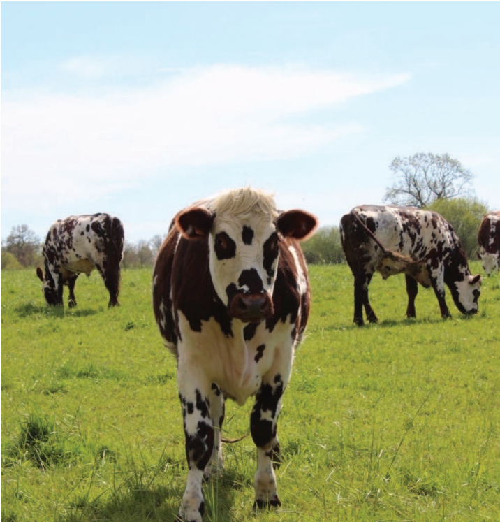
Vaches au pâturage

Petit album de photos souvenirs du séjour MAP dans la Manche.