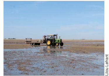
Plage de Blainville-sur-Mer

Voici un retour en images sur les différentes étapes de notre périple : de belles ballades au cœur de la baie du Mont-Saint-Michel, la rencontre avec des exploitants agricoles passionnés, la découverte de productions méconnues (laine, ostréiculture) et une meilleure