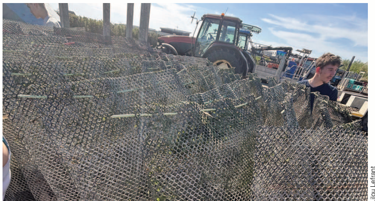
Transport des poches d'huîtres