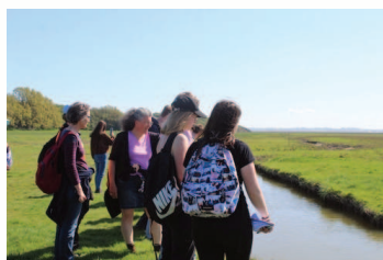
Baie du Mont-Saint-Michel