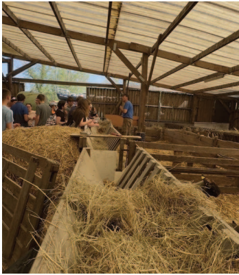
Au GAEC Vanupieds