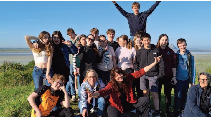
Une bien belle équipe !