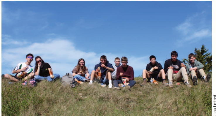
La pause s'impose