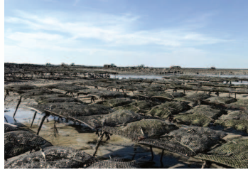
Le parc ostréicole