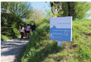
Découverte du secteur de Vains