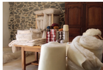
Débouchés de la laine