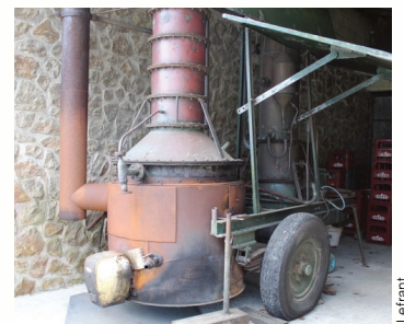
Un alambic de qualité !