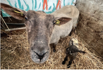
Une brebis et son agneau

Présentation générale et en chiffres des différentes exploitations ovines du territoire manchois.