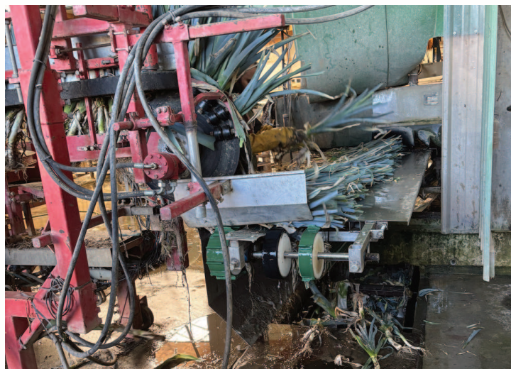
Débobineuse à poireaux