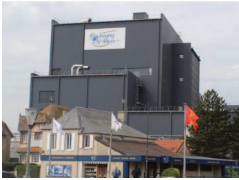
Le site de la Coopérative

La classe de 1ère CGEA du lycée Le Robillard a visité la coopérative d'Isigny-Ste-Mère.