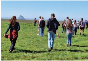
Découverte des prés salés

Si le Pays d'Auge offre déjà un terrain idéal pour aborder ces thématiques, sortir du territoire reste toujours une formidable source de motivation. Ce stage découverte a permis aux élèves de conforter leurs