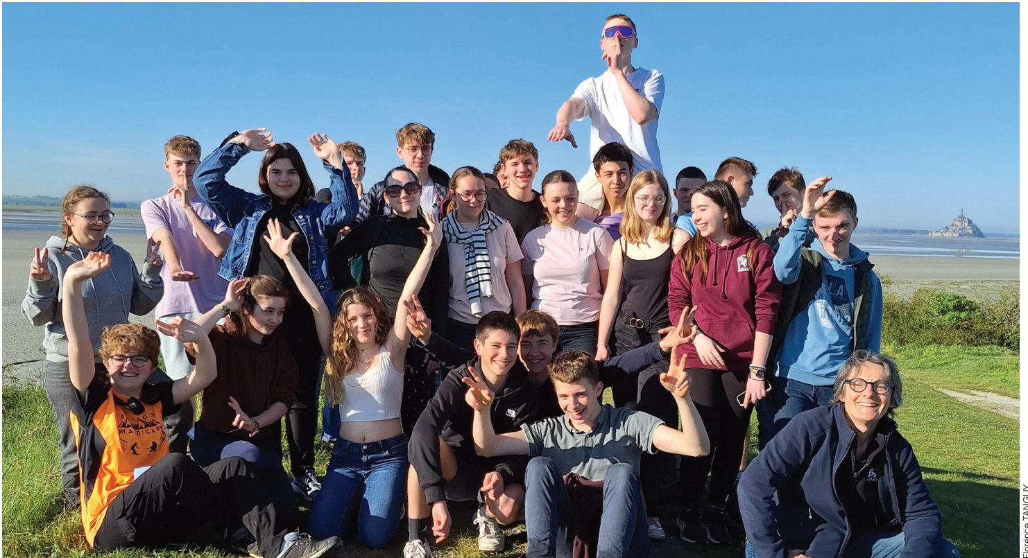
La classe de 1ère CGEA près du Mont-Saint-Michel