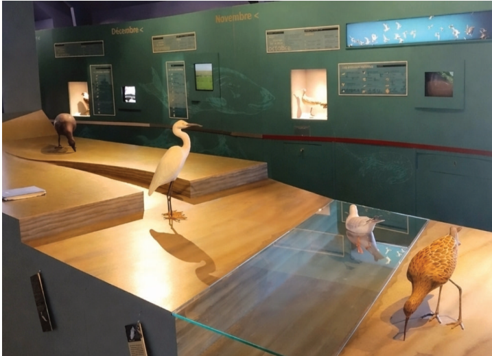
Salle avec les oiseaux présents dans la baie du mont-Saint-Michel