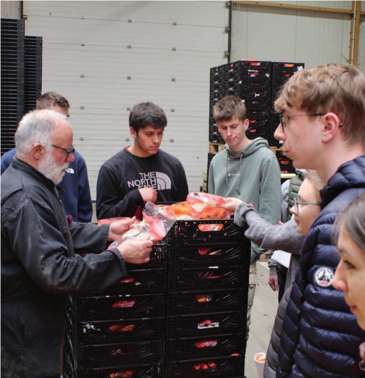
Vérification de la mise sous sachets des carottes