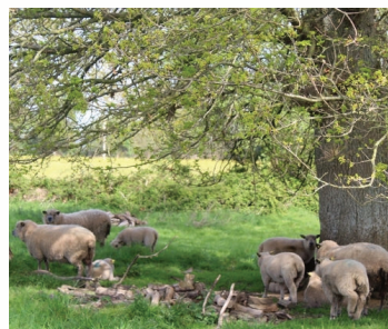
Moutons Avranchins au pâturage