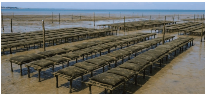
Le parc à huîtres où grandissent les bébés huîtres