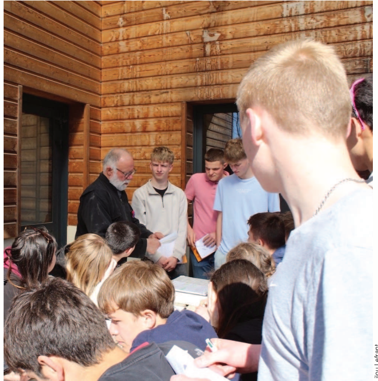
Explications sur le fonctionnement des micro-parcelles