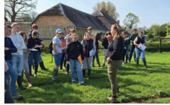
Rencontre avec une éleveuse à Marchésieux

Un grand merci à tous ceux qui ont contribué à la réussite de ce séjour, et une mention