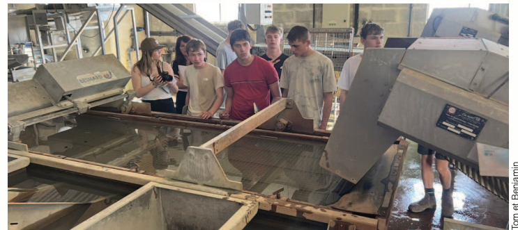
Étape du dédoubleage (tri des petites et des grosses huîtres)