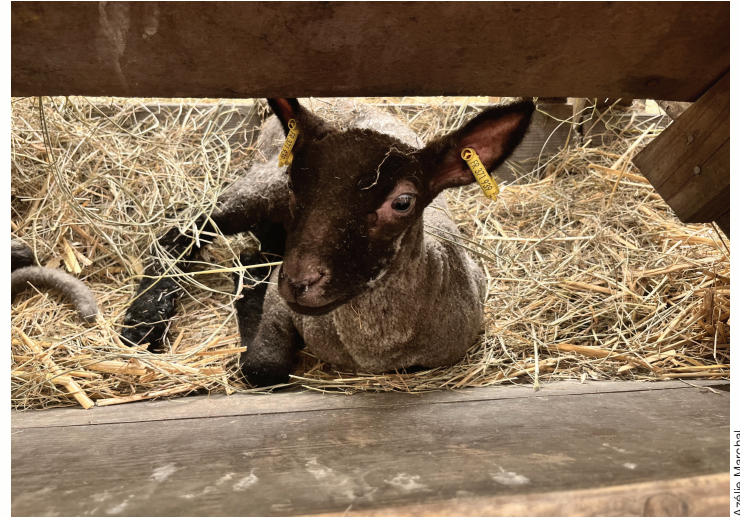
Un agneau tout mignon !