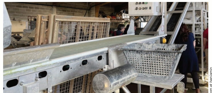
Étape du calibrage des huîtres afin de confectionner les bourriches