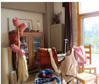
Un échantillon de ce qui peut être créé avec la laine des moutons

Pour vous embarquer dans notre aventure, et vous donner envie de découvrir à votre tour ce beau département de la Manche, nous vous offrons quelques clichés emblématiques de nos visites.