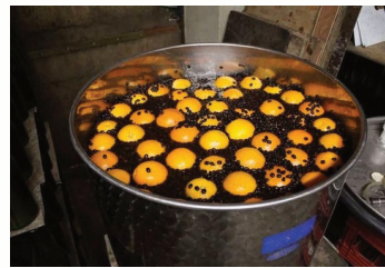
Liqueur 44 en préparation

vados, élevés en fûts de chêne pendant plusieurs années. Côté commercialisation, la cidrerie privilégie les circuits courts : 50 % des ventes se font directement à la ferme, tandis que l'autre moitié est distribuée dans les restaurants et commerces locaux. Entre respect des traditions, engagement environnemental et ancrage local, la cidrerie des Cluids illustre le dynamisme et l'authenticité de l'agriculture normande d'aujourd'hui.