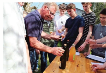
Dégustation en fin de visite

sont pas traités et de nombreuses haies, jusqu'à 800 mètres par hectare, ont été replantées pour protéger les vergers et favoriser la biodiversité. La qualité des produits est au cœur des priorités. Les variétés de pommes utilisées sont principalement amères et douces-amères, indispensables pour produire un cidre équilibré. Grâce à ces choix, les deux tiers de la production bénéficient de l'Appellation d'Origine Protégée (AOP), un gage de qualité et d'authenticité. L'exploitation produit également du pomeau et du cal-