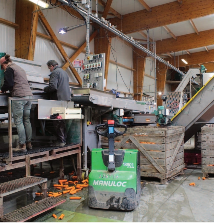
Sur la chaîne de tri

Visite, en images, de l'exploitation de Lessay.