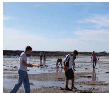
À la découverte de l'ostréiculture