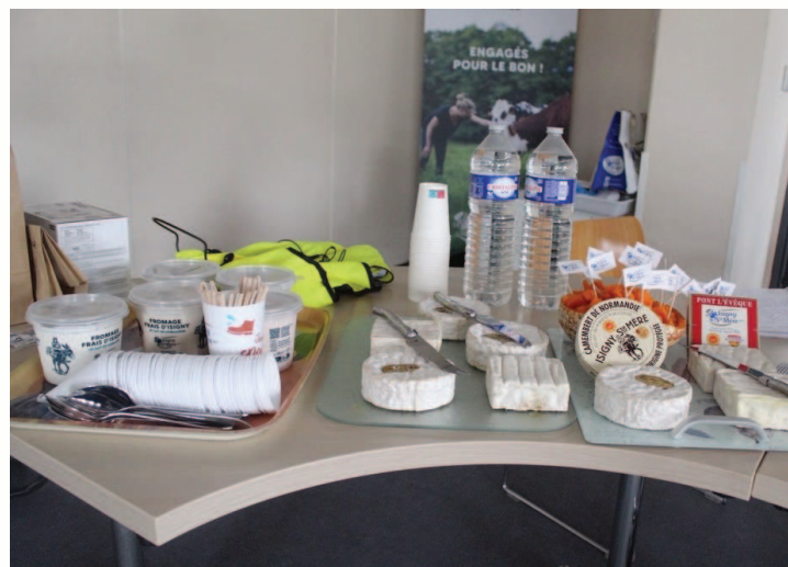
Petite dégustation savoureuse des produits de la Coopérative

Faux. Elle a remporté 19 médailles d'or, rien que pour ses fromages frais sans colorant ni arôme artificiel. Nous avons d'ailleurs eu la chance d'en déguster lors de notre visite : ils ont remporté un franc succès ! En 2026, trois médailles d'or supplémentaires ont été remportées pour son beurre de baratte salé, sa crème et son camembert.