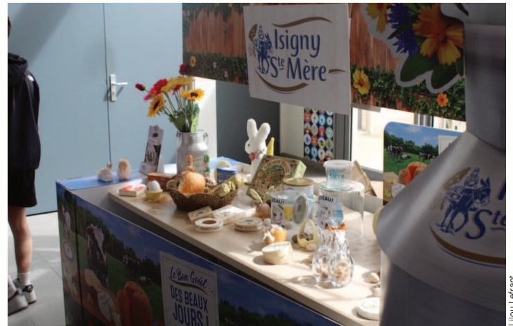
La boutique de la Coopérative d'Isigny