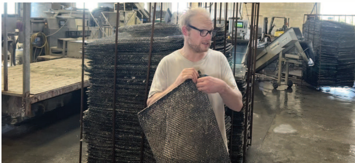
Le naissain (bébé huître) est mis dans le sac

Avec notre classe, nous avons visité une exploitation ostréicole nommée K'dual à Blainville sur Mer.