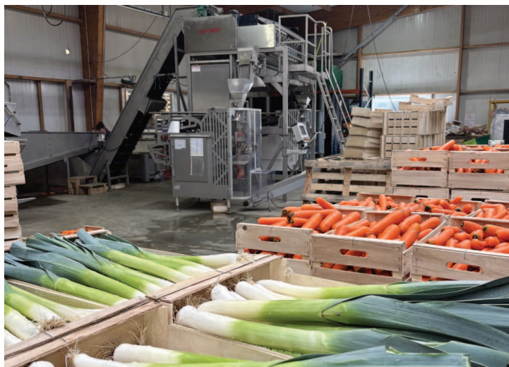
Conditionnement des légumes